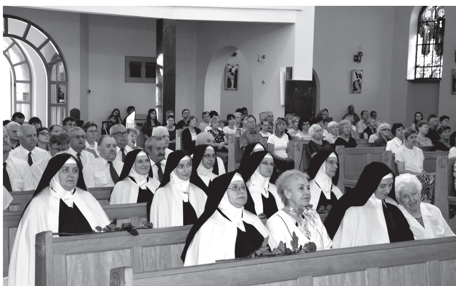
29 czerwca 2017 r. 25-letnią postugę w Sanktuarium Matki Bożej Ostrobramskiej uroczysto zakończyły Siostry Karmelitanki Dzieciątka Jezus