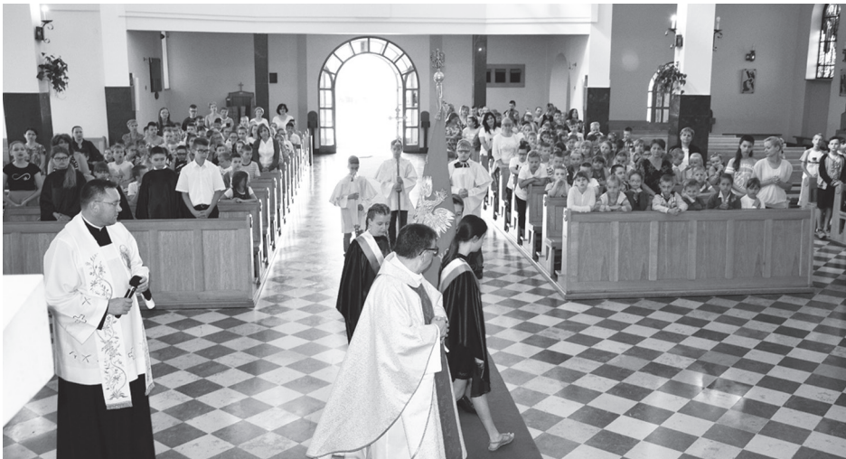
Grono pedagogiczne Szkoły Podstawowej nr 5 im. św. Jana Pawła II dzieci i młodzież z pocztą sztandarowym zakończyli rok szkolny Mszą św. i zawierzeniem Matce Bożej Ostrobramskiej