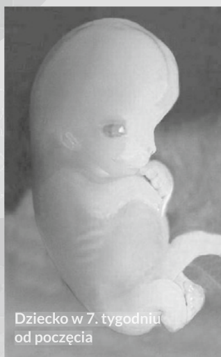
Dziecko w 7. tygodniu od poczęcia

Długość ciała dziecka wynosi 2 cm. Serce uderza 160–180 razy na minutę. Gruczoły płciowe są już mocno zróżnicowane, więc można określić płeć, choć w badaniu USG jeszcze jej „nie widać”.