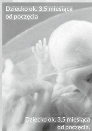
Dziecko ok. 3,5 miesiąca od poczęcia

Serce dziecka przepompowuje 30 l krwi na dobę i można je usłyszeć przez stetoskop. Płód połyka 1 l płynu owodniowego, który dostarcza mu wodę i składniki odżywcze. Dzięki temu dziecko ćwiczy mięśnie potrzebne po narodzinach do jedzenia, oddychania i mówienia. Sylwetka mamy się zmienia.