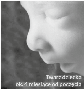
Twarz dziecka ok. 4 miesiąca od poczęcia