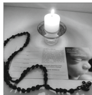
25 marca br. w Uroczystość Zwiastowania Pańskiego, podczas Mszy o godz. 18.00