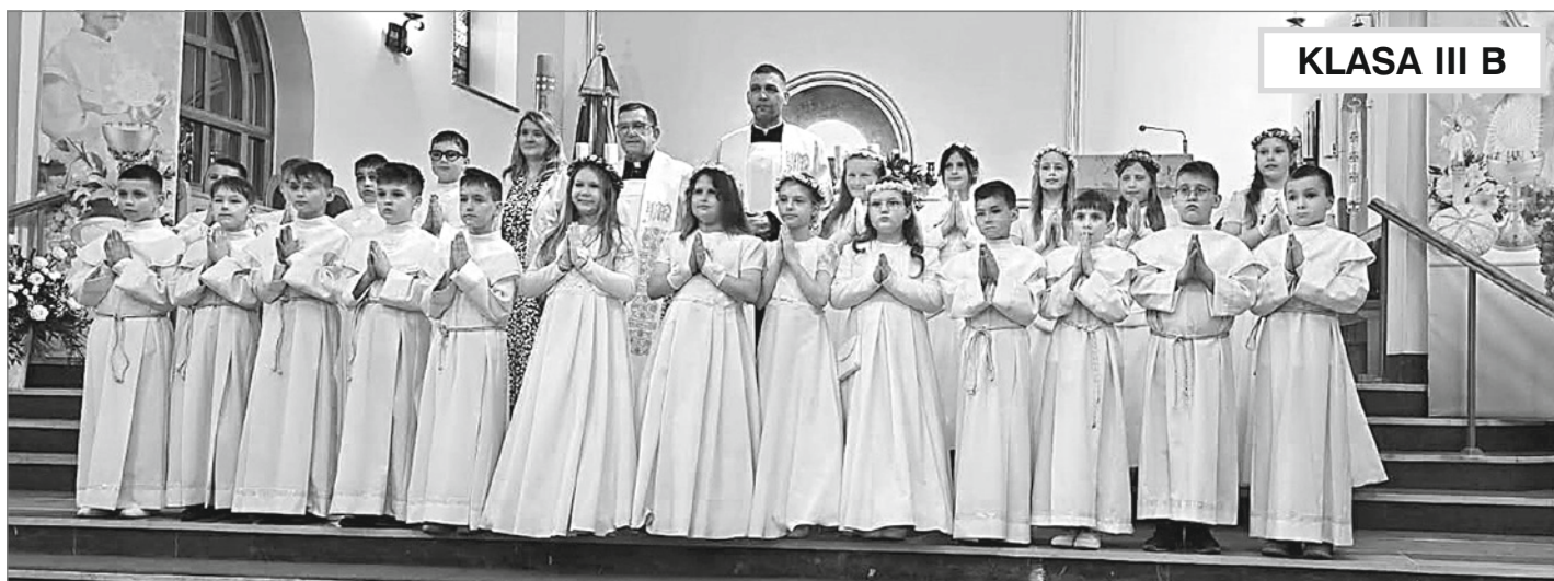
KLASA III B