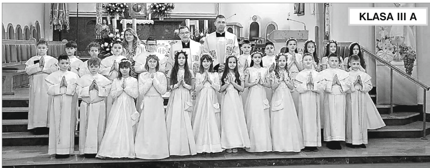
KLASA III A